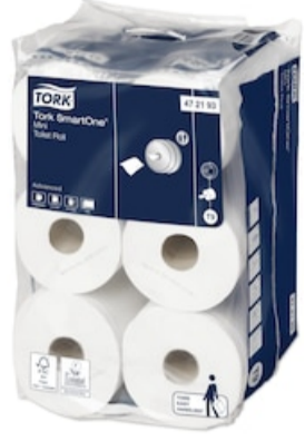
Tork SmartOne® Papel higiénico Mini 472193